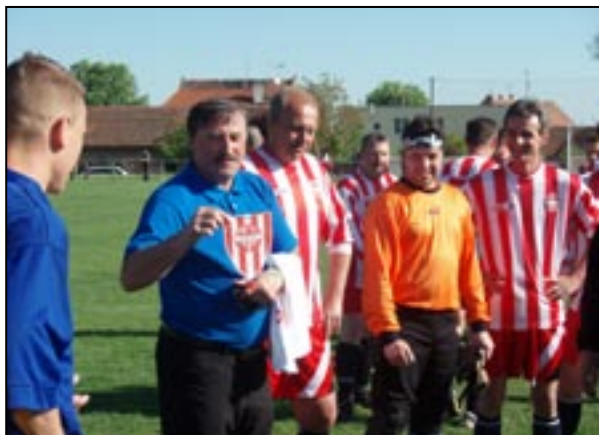
Antonín Panenka byl hostem ve Slivenci v roce 2007, kdy provedl slavnostní výkop oblíbeného derby mezi Slivencem a Holyní