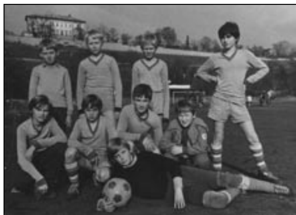
Žáci Slivence v devadesátých letech na hřišti ve Vršovicích

V polovině nového soutěžního roku 1990/1991 skončilo A mužstvo na 1. místě v I. B třídě začal skutečný boj o postup do vyšší soutěže. V jarním kole vrcholil boj o postup do I. A třídy s mužstvem Libu-