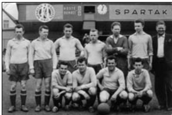
Před utkáním se Spartakem Radotín v roce 1962 na hřišti soupeře

V roce 1961 se pokračovalo ve výstavbě hřiště a dlužno podotknout, že JZD Sliveneček se postaral o oblečení jednoho mužstva. Hráči A mužstva zakolísali a skončili na podzim na posledním místě. Ve