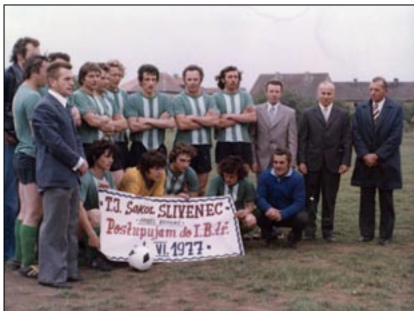
Byl vybojován postup do I. B třídy