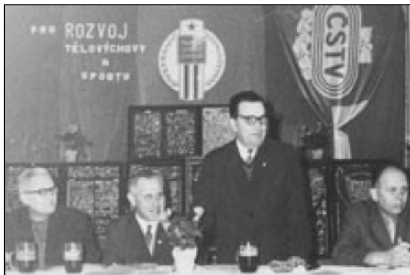
Ze slavnostního zasedání funkcionářů i fotbalových příznivců v roce 1974