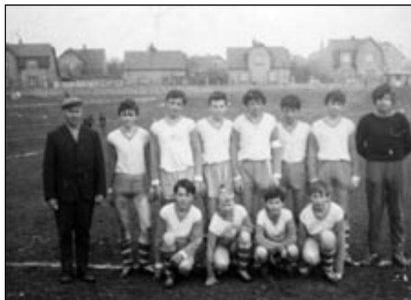
Žáci v roce 1970