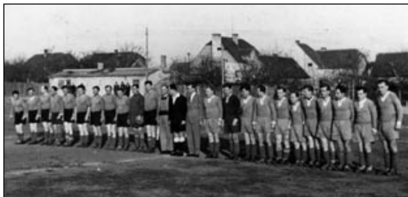
Stará garda – mužstvo A

své soutěže bez strachu ze sestupu. Mužstvo A bojovalo v sezoně 2006/2007 o postup do přeboru Prahy, ale porážky 0:2 s Vyšehradem a 1:2 s Nebušicemi ho nakonec odsunuly na 3. místo. Starší žáci získali v roce 2006 zasloužené 1. místo a vybojovali postup