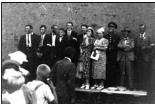
Nadšení diváci sledují přátelský zápas se Slavií