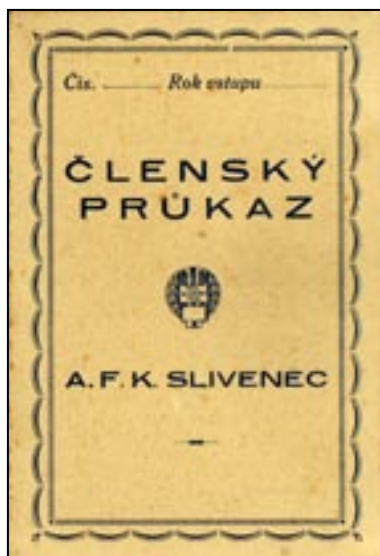
Starý průkaz zapůjčil pan Poc

věd' zněla: „ nech to na příště, já nemám s sebou peníze “.