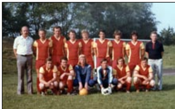
Mužstvo kolem roku 1985