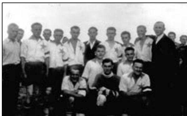
V roce 1938

V zimě, když se nekonaly fotbalové zápasy, hrálo se pod hlavičkou AFK divadlo, o něž se zasloužil zejména pan Pišvejc. Ale i v zimních měsících byly uspořádány pohárové zápasy, kterých se AFK pravidelně zúčastňoval v Hlubočepích; v letních měsících se hrály pohárové soutěže ve Slivenci za účasti Chuchle, Lochkova a Barrandova. V roce 1934 klub o pouhé dva body nepostoupil do vyšší třídy. Tak jako každoročně, také v roce 1935 se pořádal karneval s názvem „Zájezd AFK do Afriky“. Avšak „Afrika“ tentokrát vůbec nepomohla pokladníkovi, který oznámil stav účtu, tedy dluh ve výši 8372,95 Kč, což byla v těch