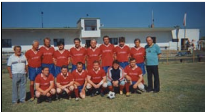
Mužstvo A v roce 2005

do 1. třídy, ale všichni přešli do mladšího dorostu a vyšší soutěž neměl kdo hrát. Mladší dorostenci byli na základě výsledků z žákovské kategorie zařazeni do 1. třídy, z které však v roce 2008 sestoupili. Přípravka pod vedením trenérů Jaroslava Sedlického a Jiřího Kubáta zatím končí v posledních dvou ročnících na konci tabulky; věříme však, že dobré výsledky se dostaví, neboť chlapi mají chuť a snahu něčeho dosáhnout. Umístění dospělých mužstev je v posledních ročnících celkem stabilní.