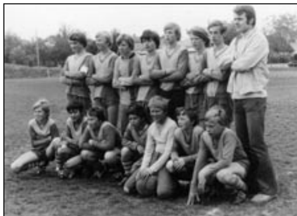
V roce 1974

titulu v turnaji v malé kopané, pořádané SSM, za spoluúčasti školního výboru ZDS. Předcházely tomu kvalifikační zápasy v okrese Praha-západ. V krajském kole, které se hrálo v Příbrami, získali též první místo