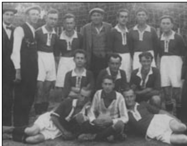
První fotbalový tým v roce 1924

První zmínky o kopané v Praze jsou z doby přibližně před 120 lety, tedy okolo roku 1891, a třicet let poté se našli nadšenci pro tento sport i ve Slivenci. Byli to většinou mladíci, kteří v té době navštěvovali fotbalové zápasy v Praze, Hlubočepích a na Zlíchově. Protože