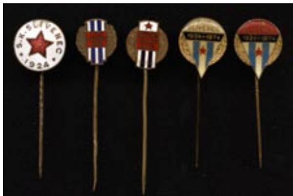
Sbírka odznaků AFK Sliveneček se postupně pěkně rozrostla

výroční zprávě se v roce 1962 dočteme, že žákovské družstvo nemělo žádná finanční vydání, k zápasům dojíždělo na kolech a občerstvení si platili žáci sami; v pohárovém turnaji v Lochkově obsadili 2. místo a v mistrovské soutěži skončili třetí. Dorost obdržel jako přeborník okresu od OV ČSTV plaketu a hráči diplomy. A mužstvo skončilo na 8. místě.