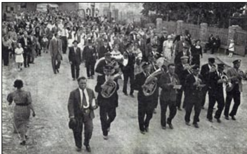
Veliký průvod doprovázel hráče Slavie na hřiště