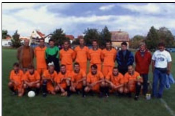
V roce 2001 xxxxx doplní autor které mužstvo xxxxx