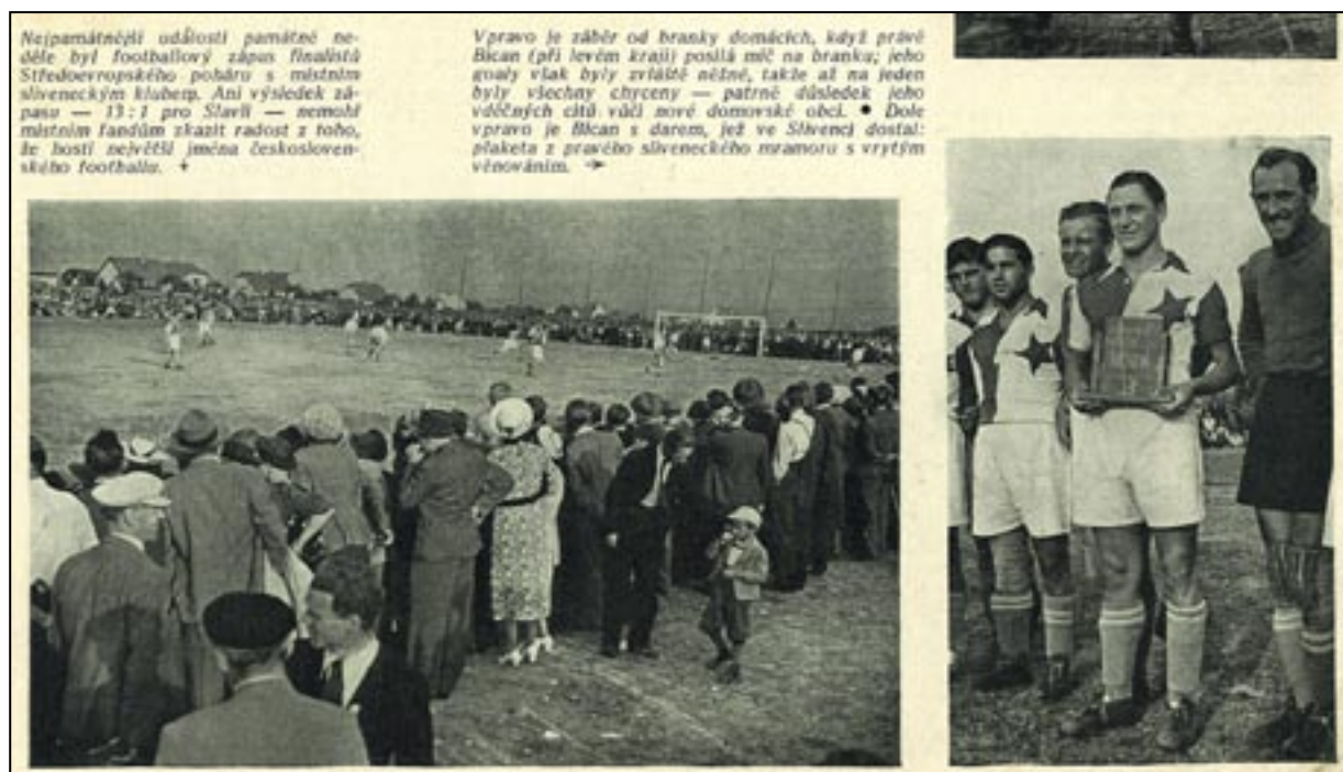
Výstřížek z novin, popisujících slavný srpnový den roku 1938 ve Slivenci