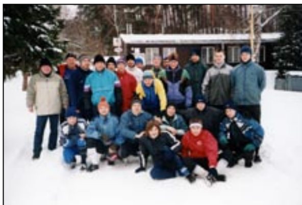
Fotbalisté na soustředění v roce 2004

Pro nejmladší sportovce byla v roce 2001 založena přípravná, kterou si vzal na starost úspěšný trenér mládeže p. Jecha. V prvním roce sice nebyly výsledky přípravy valné, ale již v následující sezoně se děti sehrály a začaly vyhrávat. V létě téhož roku vyhrála stará garda Slivence turnaj v Chyňavě. V rodné