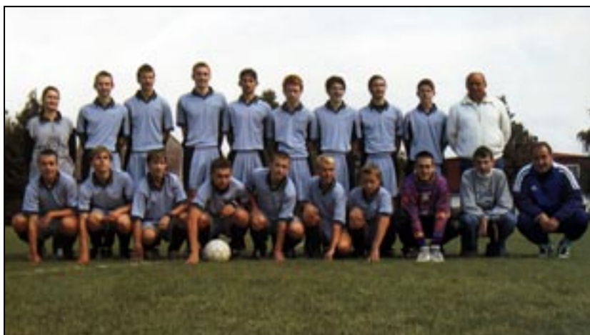
Družstvo kopané v současné době